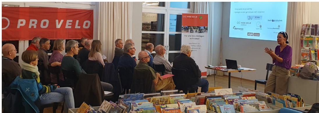
Gründungs-MV von Pro Velo Fricktal Ende 2022.